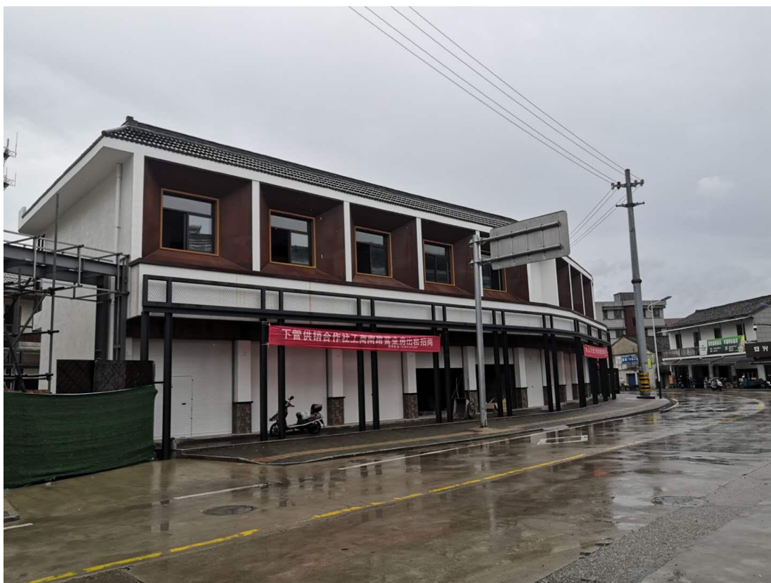
下管工商路 4#原下管茶厂正大门一层八间营